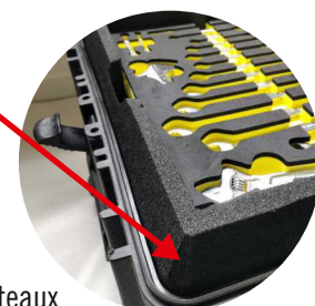
Mousse interne pour un parfait calage des plateaux