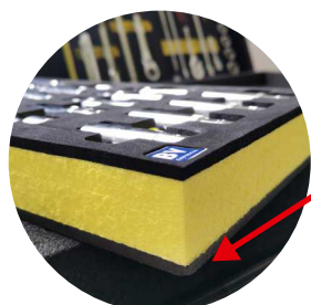
Dessous du plateau renforcé par une plaque PVC pour protéger la mousse