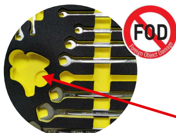
Mousse à deux couleurs pour apercevoir facilement les outils manquants