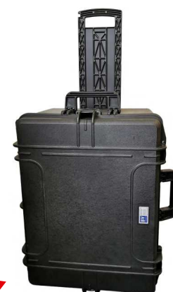
Caisse roulante, robuste et étanche